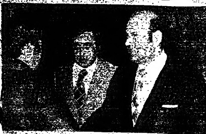
الرئيس فرنجية مع وزير الدفاع وقائد الجيش

تقد اجتمع في القصر الجمهوري ظهر امس ، برئاسة الرئيس سليمان فرنجية وحضور وزير الدفاع جوزيف سكاف وقائد الجيش العماد اسكندر فنام ، اسد حوالى نصف ساعة . وتناول الاجتماع على استعراض التطورات الأخيرة على صعيد الأمن ، والوضع على الحدود ، وتسلح اجتاح رؤساء الأركان الحرب ، وسئل الوزير سكاف عن الحالة في الكوينة ، بعد انتهاء الاجتياح ، فقال : ما تزال الاشتباكات منظمة ، بالرغم من الجهود التي تبذل من جميع الاطراف لوقف الاصطدامات ، وأضاف ردا على سؤال آخر : ان بعض المسلحين احتلوا اليوم ( امس ) بناية الصالحي ، وذلك بعد ان اخلاها مسلحون كاثوليك . وهناك رصاص يطلق من الابنية على المارة والابنية المجاورة ، وقد علينا ان مسؤولين في المقاومة الفلسطينية حاولوا اقتحام المسلحين بالانسحاب من هذه الابنية . وسئل الوزير سكاف : هل يعني هذا ان الوضع سيء ؟ فقال : بصراحة متى نخرج .. وكل الجهود نتركز الآن على وقف الاشتباكات في الكوينة ، وضبط الامور ، وتامل من جميع الفرقاء ان يتحلوا بضبط النفس ، ويراعوا مصالح الجميع . وكان وزير الدفاع قد اضى معظم فترة قبل الظهر في القصر الجمهوري .